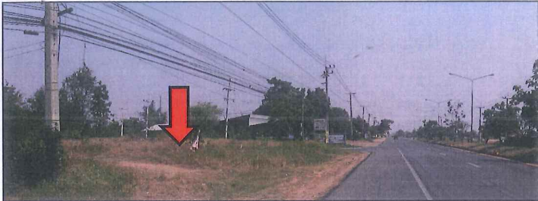
ข้อมูลเปรียบเทียบที่ 2