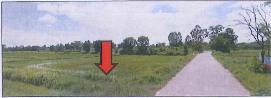
ข้อมูลเปรียบเทียบที่ 1