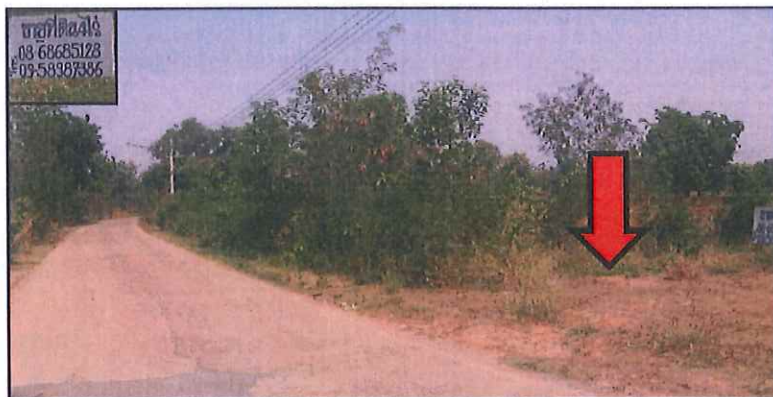
ข้อมูลเปรียบเทียบที่ 4